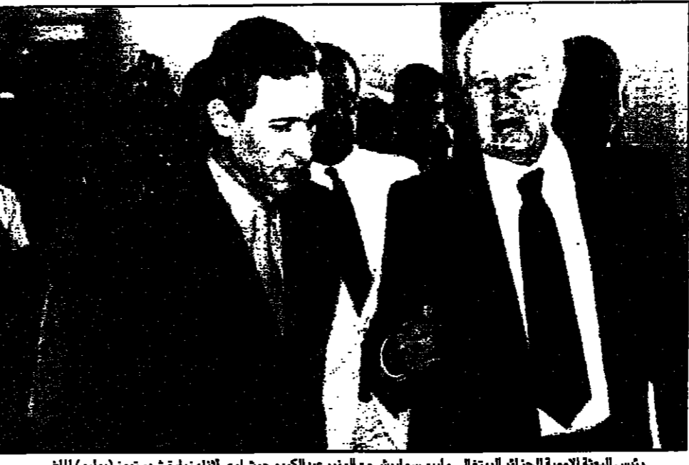
رئيس البعثة الاممية للجزائر البرتغالي ماريو سوليس مع الوزير عبدالمكريم جرشاوي أثناء زيارة شهر يوليو الماضي

3500 شخص، موضحين أيضا أن 90 % من التراب الجزائري هو اليوم في مامن عن العمليات الإرهابية ونسب البعثة اسمية هذا التحسن الايجابي في وجود صمودها الدفاع الامني في معظم المناطق للبعد. وفي هذا السياق الامني كذلك تحدث التقرير عن حالات الاختفاء، وكذا تجاوزات قوى الامن، وتعرض بعض مسؤولي المؤسسات الحكومية إلى معترهم لرهابين. وقال التقرير ان الجزائر بحاجة الى تدبير في الفهم في اجهزة القضاء وللشرطة والجيش، وكذلك في المؤسسات المسؤولة عن حماية حقوق الانسان، وعلى طول باوصت المعلومات التي حصلت عليها بوجود عمليات اعتقال تعسفية وتعتيب، واعدام دون محاكمة كما ان القضاء لم يكن يوفر حماية للمواطنين. واستطرد، فقالت حالات تقاضي فيها القضاء عن امة ملموسة على عمليات تصديب تعرض لها الافراد أثناء احتجازهم. وقال التقرير نحن ندين أي شكل من أشكال التطرف أو التصعيد قد تستحق تبرئة لأشخاص الارهابيين، لا عذر للارهاب. واضاف ان الجزائر تستحق مساعدة المجتمع الدولي في جهودها لتفادي هذه المعضلة. عبر ان التقرير قال انه لا يمكن مكافحة الارهاب الا بتعزيز في الامن وزيادة من احترام حقوق الانسان، وتكون من الجزائر ترفض منذ طويل اي تحقيق في العنف قاتلة أنه شأن